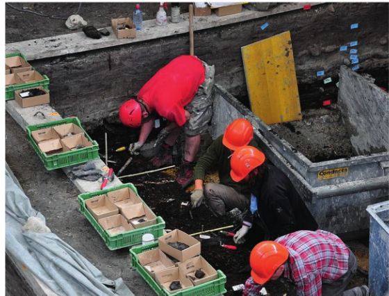
Roland zh, 2010, CC BY-SA 3.0

Principalmente sono uno studioso. Lo so, arriccerai il naso: "ah quanto è pesante studiare!" ma il mio studio è particolare: parte con una ricerca in biblioteca e poi si sposta sul territorio, quindi viaggio e scopro luoghi nuovi.